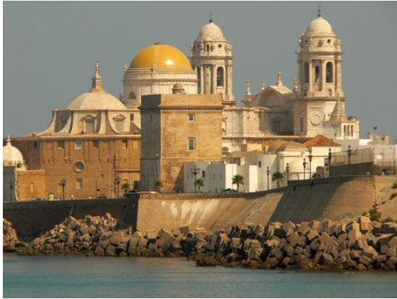
Cádiz mit Kathedrale

Am vierten Tag setzen wir mit der Fähre von Sanlúcar aus in den Naturpark Doñana über. In geländegängigen Fahrzeugen entdecken wir eine Landschaft aus Dünen, Pinienwäldern und Vogelparadiesen, bevor wir das Wallfahrtsdorf El Rocío erreichen – ein Ort, an dem die Zeit stehen geblieben zu sein scheint.