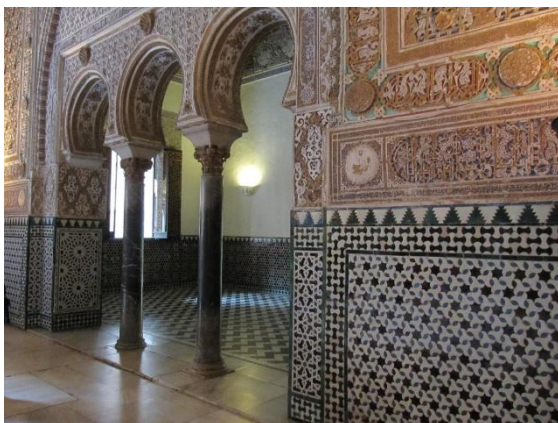
Sevilla und der Alcázar