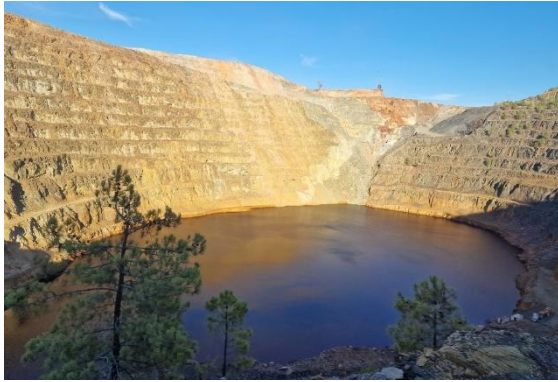
Kupferabbau von Río Tinto

Die letzten beiden Tage widmen wir noch einmal ganz Sevilla: dem märchenhaften Alcázar, der imposanten Kathedrale und dem unverwechselbaren, lebendigen Rhythmus Andalusiens.