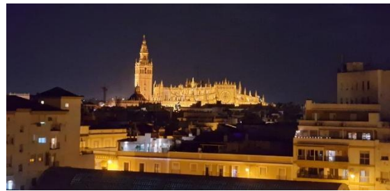
Sevilla mit Kathedrale

Hier erleben wir das authentische Flair einer Sherry-Stadt – natürlich inklusive Degustation in einer traditionellen Bodega.