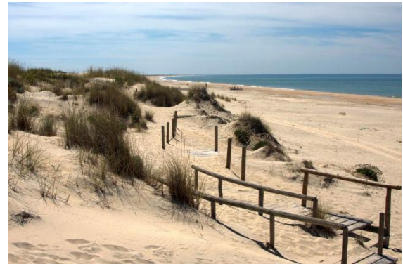
Parque Dunar bei Huelva

Auf dieser Reise unternehmen wir verschiedene Wanderungen, die es jeweils in einer kürzeren und längeren Version gibt.