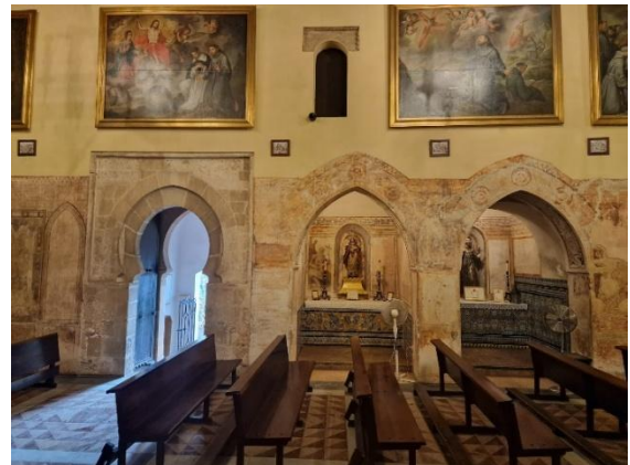
Das Kloster La Rábida

Von hier aus folgen wir den Spuren von Christoph Kolumbus: Wir besuchen das Kloster La Rábida sowie Palos de la Frontera, den historischen Hafen, von dem aus seine Karavellen einst in See stachen.