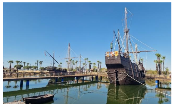
Die Karavellen von Kolumbus

Auf der Rückfahrt begegnen wir den Kontrasten der Region: fruchtbare Erdbeerfelder und die eindrucksvollen, fast surreal wirkenden Minenlandschaften von Río Tinto begleiten uns auf dem Weg zurück nach Sevilla.