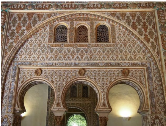
Sevilla mit dem Alcázar, dem Königspalast

Die letzten beiden Tage widmen wir noch einmal ganz Sevilla: dem märchenhaften Alcázar, der imposanten Kathedrale und dem unverwechselbaren, lebendigen Rhythmus Andalusiens.