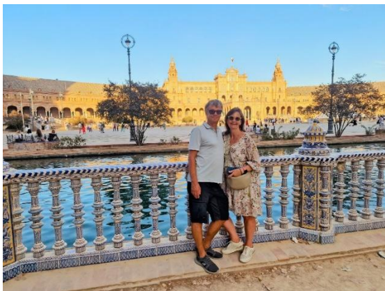
Sevilla mit Plaza España

Wir beginnen unsere Reise in Sevilla mit einem stimmungsvollen Abendspaziergang durch die historische Altstadt. Zwischen verwinkelten Gassen, lebhaften Plätzen und eindrucksvollen Bauwerken tauchen wir ein in die besondere Atmosphäre dieser pulsierenden andalusischen Metropole und sammeln erste unvergessliche Eindrücke.