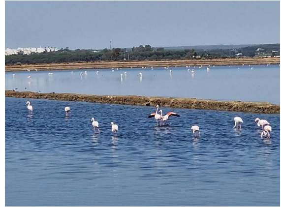
Naturpark Coto Doñana

Von hier aus folgen wir den Spuren von Christoph Kolumbus: Wir besuchen das Kloster La Rábida sowie Palos de la Frontera, den historischen Hafen, von dem aus seine Karavellen einst in See stachen.