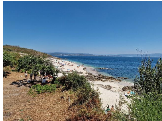
Isla de Ons

Ein unvergessliches Naturerlebnis erwartet uns auf der Isla de Ons. Mit dem Schiff erreichen wir dieses geschützte Inselparadies, wo türkisfarbenes Wasser auf feinsandige Strände trifft und die Zeit langsamer zu vergehen scheint. Bei einer Wanderung durch diese ursprüngliche Landschaft eröffnet sich eine fast unwirkliche Schönheit.