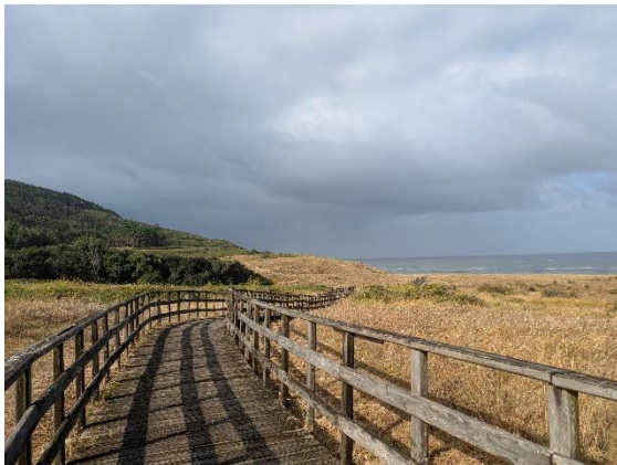
Strandwanderungen in Finisterre