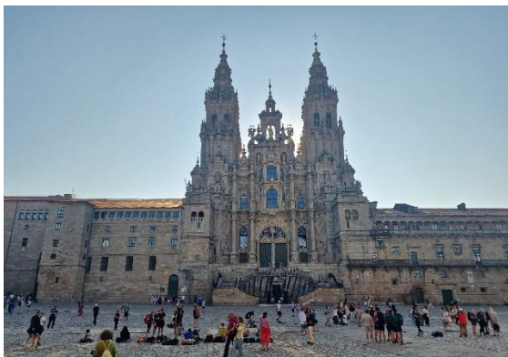
Kathedrale von Santiago

Eine Reise zwischen Atlantik, Naturwundern und kulinarischen Höhepunkten: Diese Reise führt in den geheimnisvollen Nordwesten Spaniens. Galizien empfängt uns mit tiefgrünen Hügeln, dramatischen Küsten und einer Atmosphäre, die gleichzeitig rau und berührend ist.