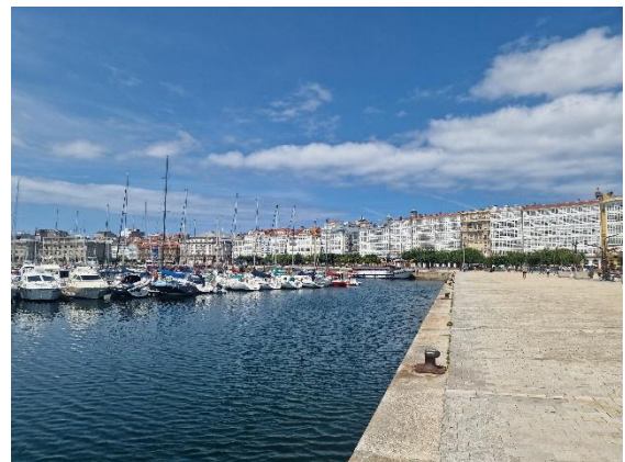
Die Mole von A Coruña

Die Reise führt uns weiter durch Küstenorte wie Laxe, wo sich das Leben in ruhigem Rhythmus zwischen Hafen und Strand abspielt, bevor wir in A Coruña wieder in das lebendige Stadtleben eintauchen. Hier treffen Tradition, Meer und urbanes Leben aufeinander und schaffen eine besondere Atmosphäre.