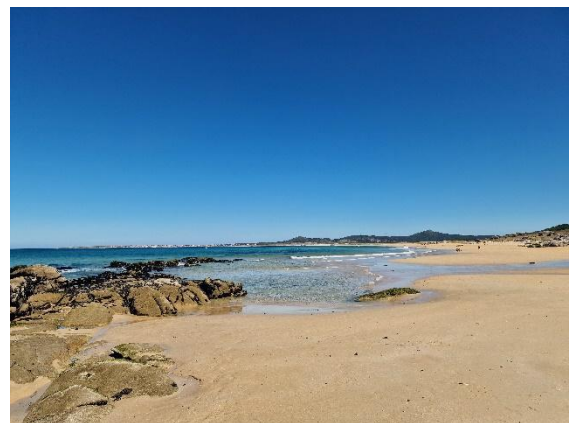
Der Strand von Corrubedo