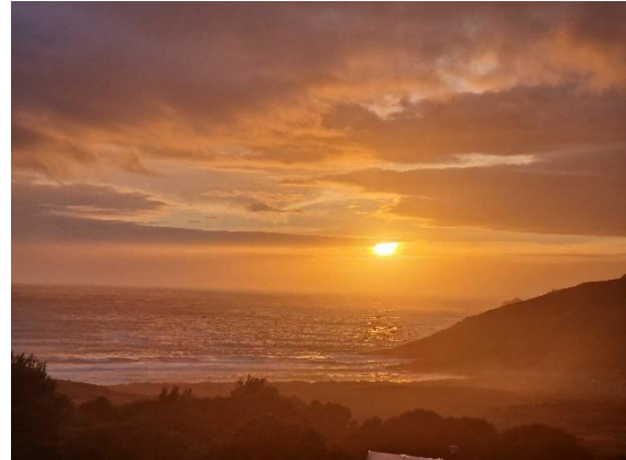
Abendstimmung in Finisterre

Die Reise führt uns weiter durch Küstenorte wie Laxe, wo sich das Leben in ruhigem Rhythmus zwischen Hafen und Strand abspielt, bevor wir in A Coruña wieder in das lebendige Stadtleben eintauchen. Hier treffen Tradition, Meer und urbanes Leben aufeinander und schaffen eine besondere Atmosphäre.