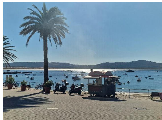
Hafenpromenade von Corrubedo

Weiter entlang der Küste entdecken wir das entspannte Leben in Corrubedo – ein ursprüngliches Fischerdorf mit weiten Stränden, sanften Dünen und das Rauschen des Atlantiks.