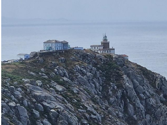
Der Leuchtturm von Finisterre

Schliesslich erreichen wir Finisterre – das sagenumwobene «Ende der Welt». Bei Wanderungen entlang schroffer Klippen wird die Kraft des Atlantiks spürbar. Der Ort ist geprägt von Licht, Meer und Wind.