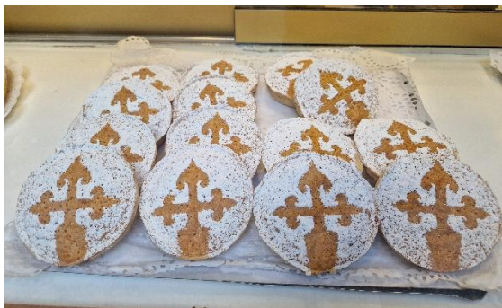
Tarta de Santiago

Den Auftakt bildet Santiago de Compostela – ein Ort voller Geschichte und gelebter Tradition. In den engen Gassen der Altstadt und vor der imposanten Kathedrale spürt man die besondere Energie eines Zieles, das seit Jahrhunderten Menschen aus aller Welt bewegt.