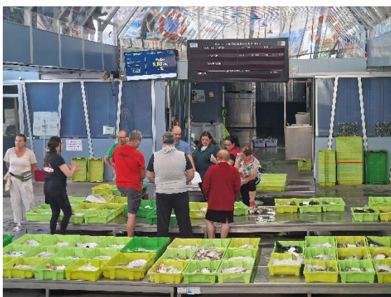
Der Fischmarkt von Finisterre