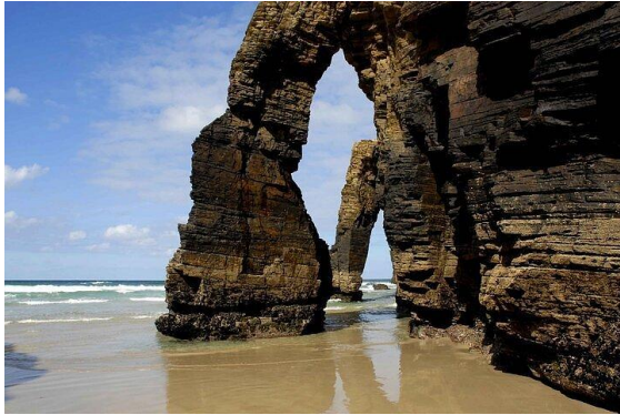
Playa de las Catedrales

Galizien ist berühmt für seine Küche – frischer Fisch, Meeresfrüchte, regionale Spezialitäten und ausgewählte Weine machen diese Reise auch kulinarisch zu einem Erlebnis für alle Sinne.