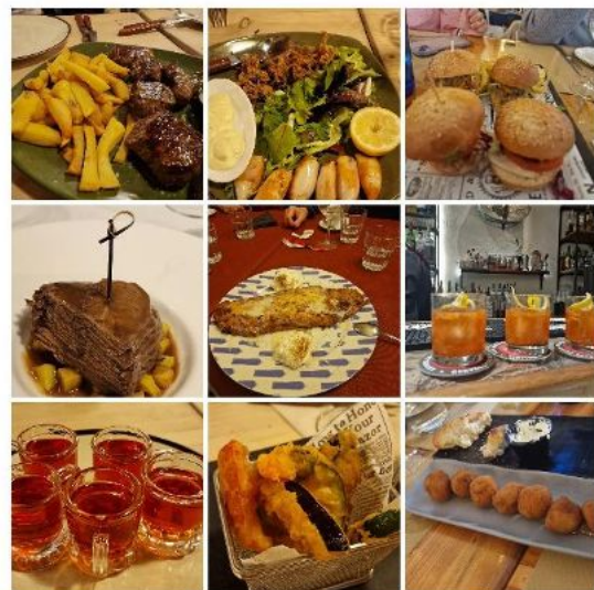
Kulinarische Leckereien in Madrid und Toledo