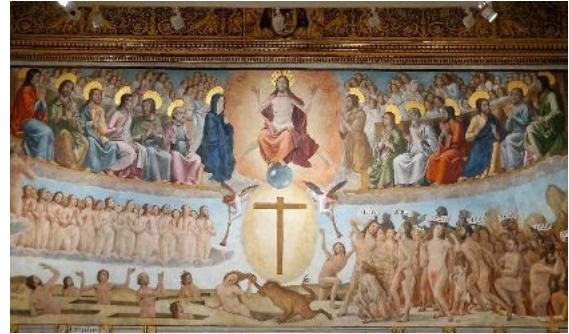
In der Kathedrale von Toledo

Unsere Kulturreise beginnt in Spaniens einstiger Hauptstadt Toledo – der Stadt der drei Kulturen. Hier begegnen sich Geschichte und gelebte Traditionen auf Schritt und Tritt: Kathedrale, Moschee und Synagoge erzählen von einem Zusammenleben vergangener Zeiten.