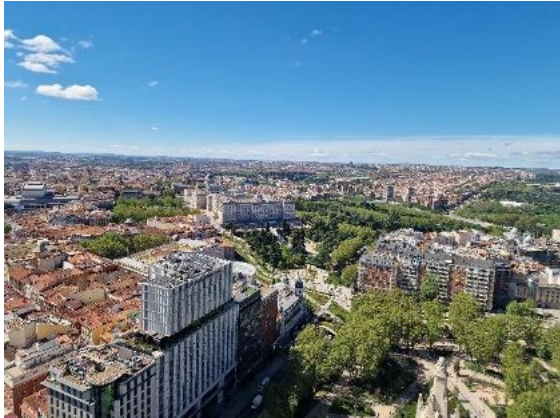
Aussicht vom Rooftop RIU

Bei geführten Spaziergängen entdecken wir die Stadt von ihren schönsten Seiten: von der berühmten Plaza Mayor schlendern wir zum prachtvollen Königspalast von Madrid und weiter zur neu gestalteten Plaza de España mit ihrer spektakulären Rooftop-Terrasse – inklusive atemberaubendem Blick über die Stadt.