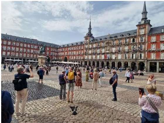
Madrid mit Plaza Mayor

Nach intensiven Kulturtagen und einem entspannten Naturspaziergang rund um Toledo geht es weiter in die lebendige Metropole Madrid.