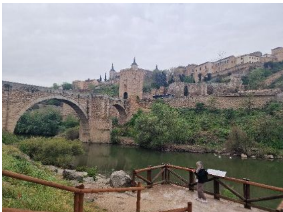
Entlang dem Tajo