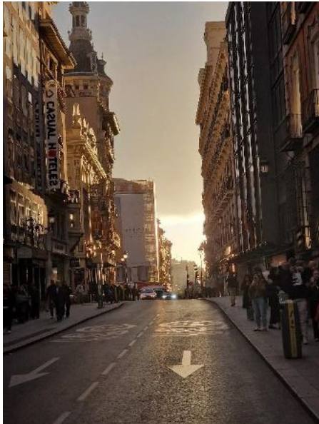
Abendstimmung im Zentrum Madrids

Auch ShoppingliebhaberInnen kommen in Madrid voll auf ihre Kosten: Ob elegante Boutiquen, bekannte Marken oder charmante kleine Läden – die Stadt ist ein wahres Paradies für alle, die gerne stöbern, entdecken und sich inspirieren lassen.