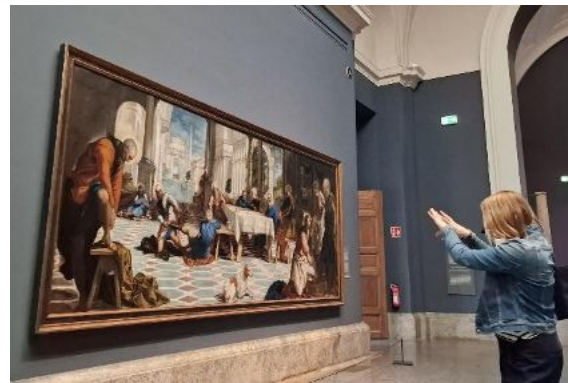
Tintoretto im Prado

Madrid begeistert als Stadt der Künste: Im Museo del Prado lassen wir uns von Meisterwerken von Goya, El Greco und Velázquez verzaubern. Im Museo Reina Sofia erwarten uns Werke von Picasso, Miró und Dalí.