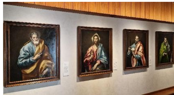
El Greco wirkte lange in Toledo