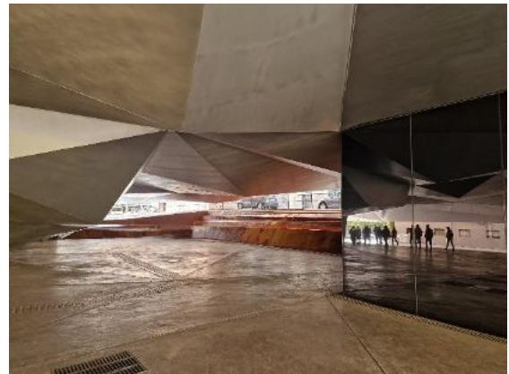
Caixa Banca Forum von Herzog/de Meuron