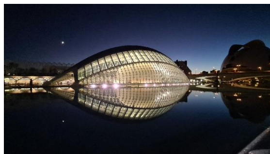
Las Artes y Ciencias in Abendstimmung

Mit Velofahrten entdecken wir während zwei Tagen die spektakuläre Architektur Calatravas sowie die Naturwildnis der Albufera mit Dünenstränden, Lagunen, Pinienwäldern und Vogelwelt.