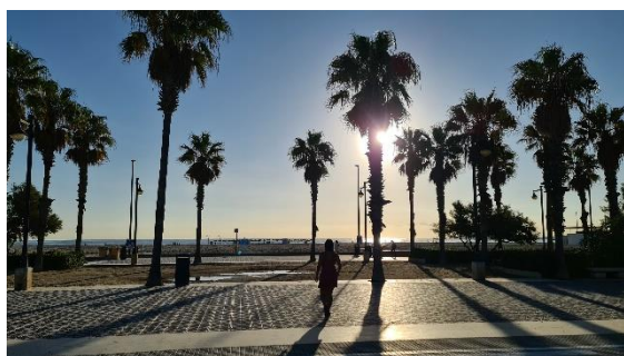
Strandpromenade von Malvarosa

Wir starten die Reise in einem Strandhotel an der attraktiven Strandpromenade der Malvarosa , von wo wir die moderne Hafenanlage mit einer Katamaranfahrt und das urige Fischerquartier des Cabañals zu Fuss erkunden und genießen.