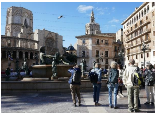
Plaza de la Virgen

Nach drei Tagen Strandhotel dislozieren wir uns in ein Hotel mitten im lebhaften Stadtkern und geniessen neben authentischer Marktatmosphäre die prachtvolle Architektur von Palästen und Kirchen aus verschiedenen Kunstepochen : von der gotischen Seidenbörse zu den barocken Fresken des San Nicolás und zum Postgebäude oder Bahnhof aus der spanischen Art Nouvel-Epoche .