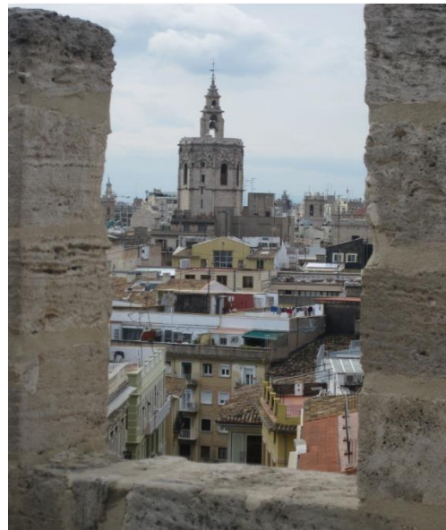
Blick über die Dächer der Innenstadt zur Kathedrale und dem Miguelete-Turm

Bei einem Abstecher ins Innenland Valencias besuchen wir ein Weingut , einen Olivenbauern mit wertvollstem Olivenöl und geniessen die Orangenhaine , nicht umsonst ist Valencia das Land der Orangen.