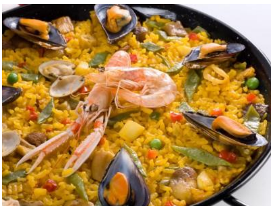
Valencia ist die Wiege der Paella