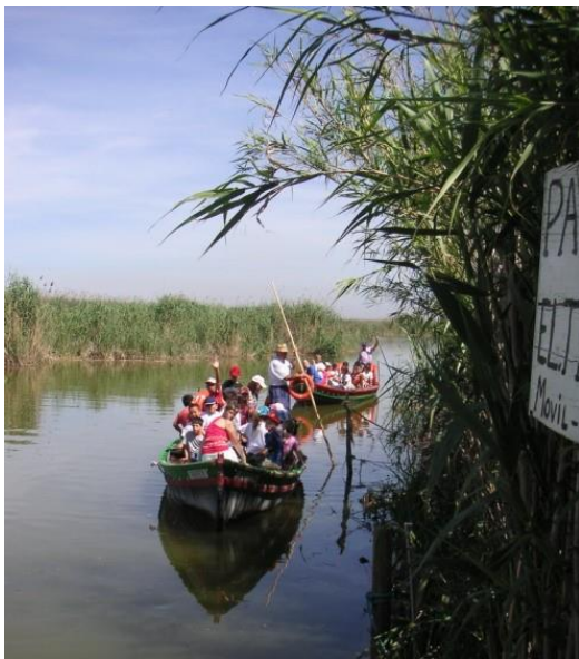
Schiffahrt auf der Albufera

Nach drei Tagen Strandhotel dislozieren wir uns in ein Hotel mitten im lebhaften Stadtkern und geniessen neben authentischer Marktatmosphäre die prachtvolle Architektur von Palästen und Kirchen aus verschiedenen Kunstepochen : von der gotischen Seidenbörse zu den barocken Fresken des San Nicolás und zum Postgebäude oder Bahnhof aus der spanischen Art Nouvel-Epoche .