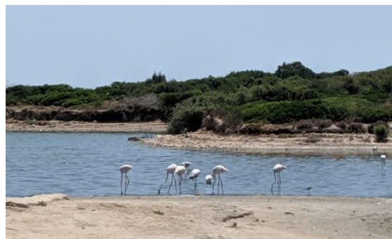
Lagunen in der Albufera

Die Albufera ist die Reiskammer Spaniens, weshalb Valencia die Wiege der Paella ist und diese in verschiedenen Variationen genießen werden