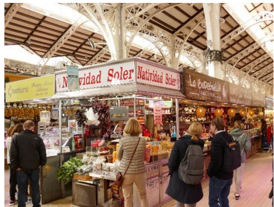
Mercado Central – die schönste Markthalle Spaniens

Zu Valencia gehört auch die Gastronomie auf höchstem Niveau . Valencias Küche ist sehr innovativ! Täglich werden wir gemeinsam Leckerbissen der spanischen Küche geniessen.