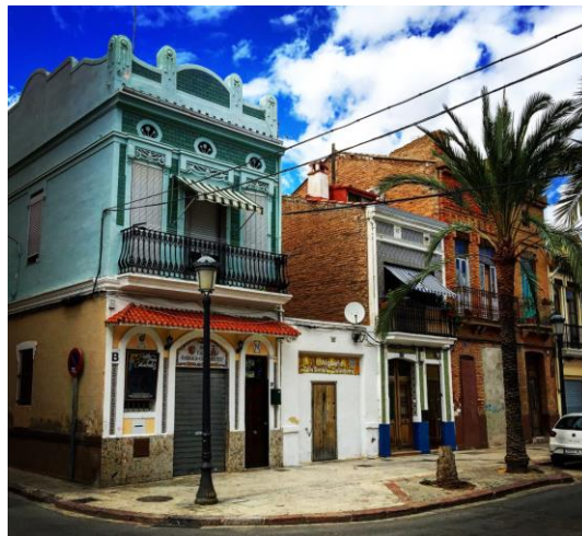
El Cabañal – unser Lieblingsquartier

Wir erkunden die Gegend an drei Tagen per Velo. Wir fahren gemütlich, sicheres Velofahren wird erwartet.